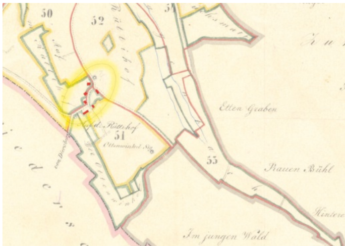
Lageplan Rittihof 1859