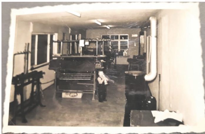
So sah es in der Strickerei aus.