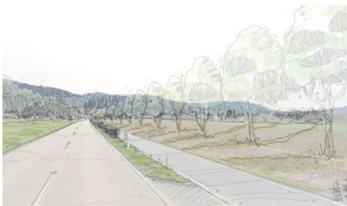
Foto: Perspektivzeichnung, wie der Radweg mit der Baumreihe aussehen kann