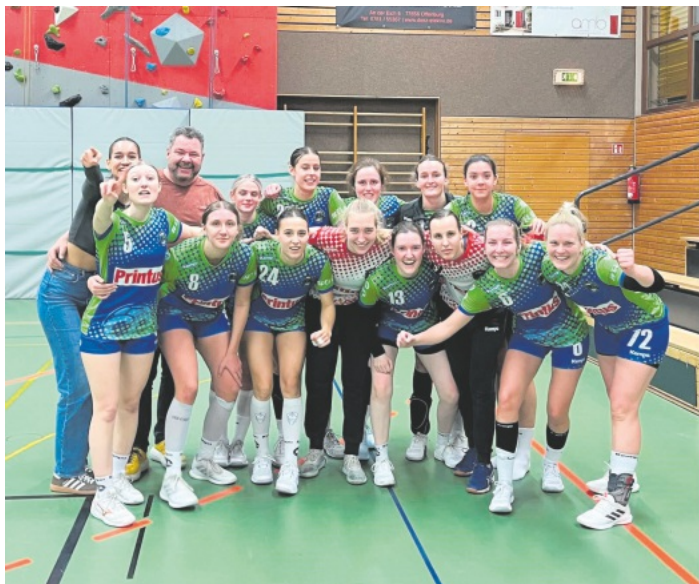
Grund zum Feiern gab es für die Damen der SG Ohlsbach/Elgersweiler/Zunsweier.