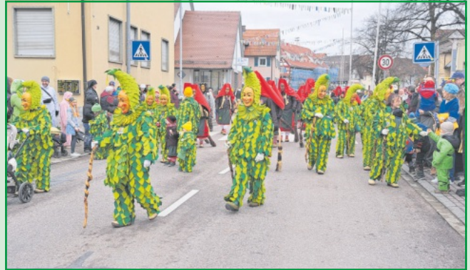
Spättle und Hexen der Narrenzunft Buhneschäfe