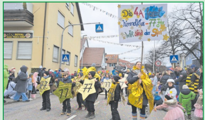
Himmelklar feiern die Sterne der Klasse 4 a