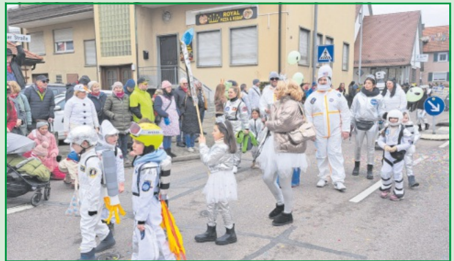
Die Astronauten der Klasse 1 b fliegen hoch bis auf den Mond