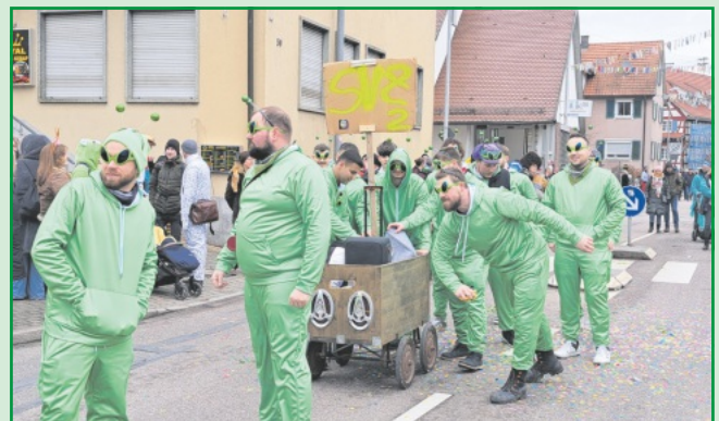
Die Handballer waren beim Umzug außerirdisch