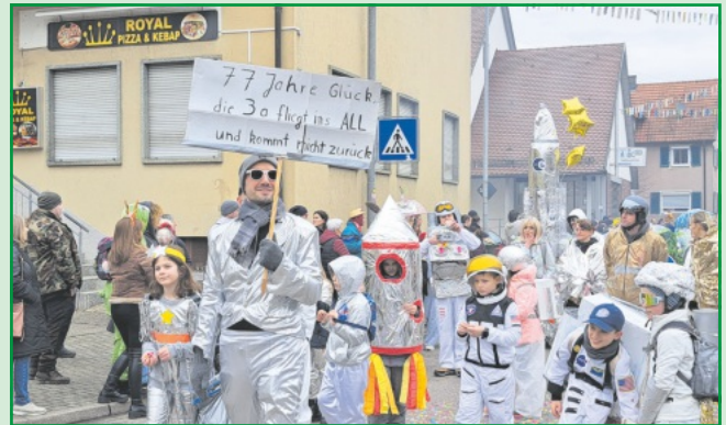
Die Kinder der Klasse 3 a fliegen ins All