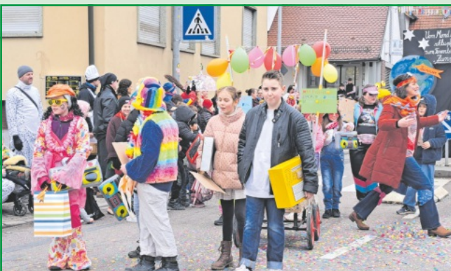
Mit ihren UKW Radios funkt die Klasse 4 b