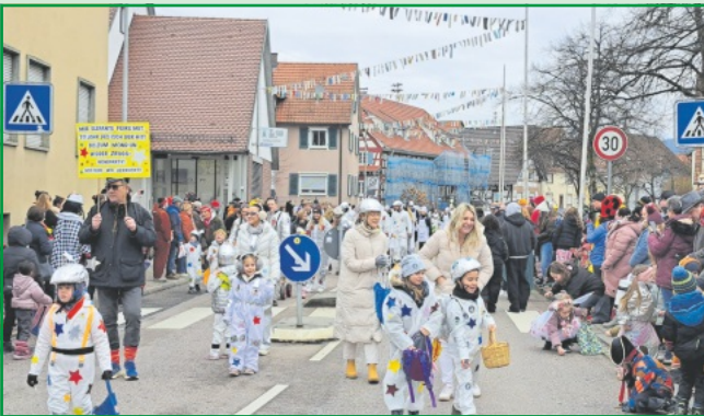
Die Elefantengruppe sind die Astronauten des Kindergartens