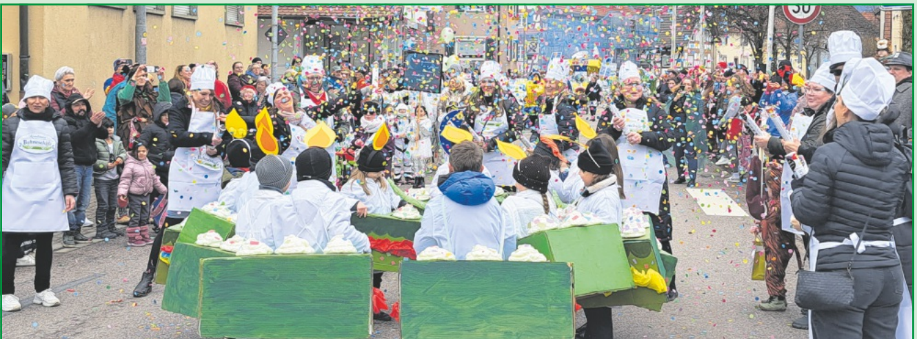
Die Klasse 1 a als Tortenstücke aus der Konditorei Buhneschäfe mit 7x11 Kerze uff m Küche druff