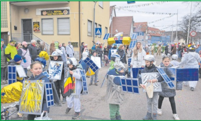
Bei den Klassen 2 a und b spielen die Satelliten verrückt