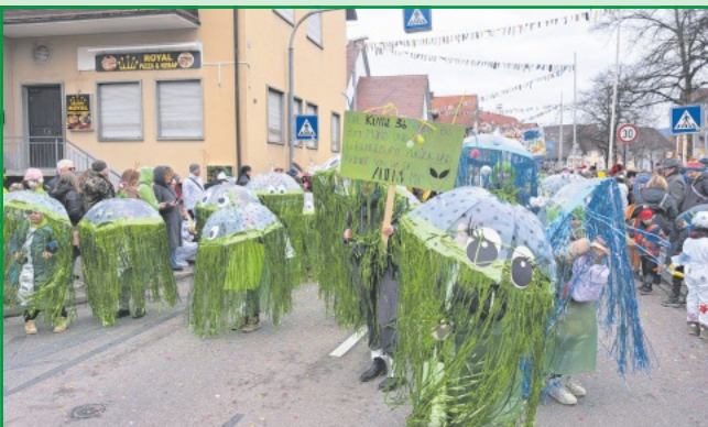
Die Klasse 3 b bringen Aliens vom Mond mit