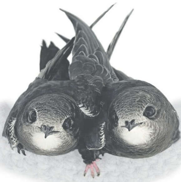
Mauersegler-Nestlinge in einer Pflegestelle

legene Nistquartiere auf bis zu 70 bis 80 °C erhitzen. Die jungen Mauersegler suchen dann nach Abkühlung, wobei sie sich nicht selten so weit aus ihrem Nistplatz strecken, dass sie den Halt verlieren und zu Boden stürzen. Dort sind sie aber hilflos, denn im Gegensatz zu den meisten Singvogelarten werden Segler am Boden von ihren Eltern nicht weiter versorgt. Aber auch Altvögel können unter den sommerlichen Extrembedingungen Probleme bekommen und zu Boden gehen. Ein sich am Boden aufhaltender Mauersegler – egal ob Jung- oder Altvogel – ist immer ein Notfall und hat ohne menschliche Hilfe keine Überlebenschance. Deshalb bitten wir Sie: wenn Sie einen Mauersegler finden, bergen Sie ihn und kontaktieren Sie eine sachkundige Pflegestelle (bitte niemals einen Mauersegler in die Luft werfen!). Dort haben sie eine gute Chance, ein paar Wochen später als gesunde Jungvögel in ihr Leben im Flug durchzustarten.